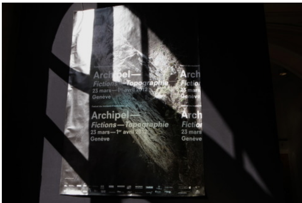
FESTIVAL ARCHIPEL - Genève mars 2012

Archipel a contribué avec d'autres à faire des musiques d'aujourd'hui un élément important et reconnu de la vie comme de la culture musicale genevoise. Le festival réunit chaque année un public nombreux et divers tant par l'âge que par les goûts musicaux. Il est aujourd'hui plus que jamais un festival international.