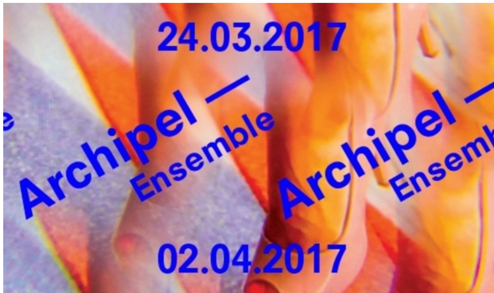
Capture d'écran de la page Facebook du festival.

Le festival va réaffirmer le modèle social de la musique du 24 mars au 2 avril à Genève.