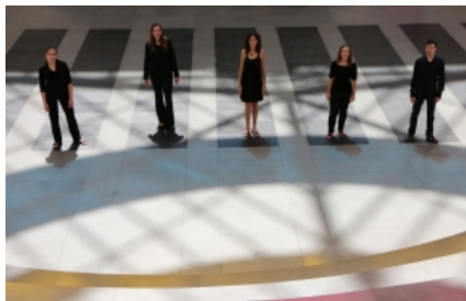
Le jeune ensemble genevois Batida mêle la beauté acoustique des instruments percussifs au spectre des musiques électroniques.

«Ensemble!» Ce mot d'ordre résume le credo et la thématique du Festival Archipel qui célèbre, pour sa 26e édition, la vitalité de la création musicale contemporaine helvétique. Si le mot «crise» revient régulièrement dans les débats sur la musique d'aujourd'hui, ce constat est loin d'affoler ceux qui, de Genève à Coire, en passant par Berne, Bâle et Zurich, s'unissent au sein de nouveaux collectifs tels que Batida, Trio 46°Nord, Eunoia, Ö, NeuverBand, Proton ou Ensemble Vide.