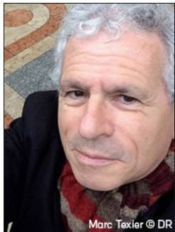
Marc Texier © DR

Depuis 1992, le Festival Archipel organise chaque printemps une série d'événements qui reflètent toutes les formes de la création musicale actuelle dans divers lieux culturels de Genève. Intitulé Ecce Robo , la thématique du festival surfe cette année sur la vague de la robotisation galopante, faisant la part belle aux installations sonores et plastiques, reflets de soixante ans de recherche artistique qui touche à l'intelligence artificielle.