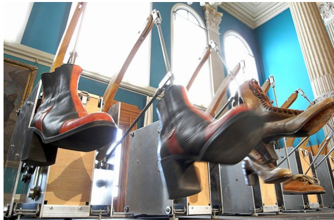
«Les Souliers», une installation d'Arno Fabre présentée au Musée d'art et d'histoire de Genève. Elle sera visible, avec «Astragale Zénon l'arpenteur», durant toute la durée du festival. ARNO FABRE

Les Souliers a beaucoup et bien voyagé en France et en Europe. Elle constitue une petite pièce d'un continent artistique foison-