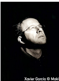
Xavier Garcia © Maki

«La force et la vitalité de la musique de Xenakis font écho à l'action du film et à sa violence.»