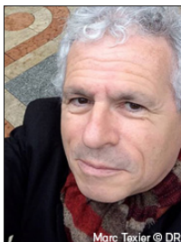
Marc Texier © DR

Depuis 1992, le Festival Archipel organise chaque printemps une série d'événements qui reflètent toutes les formes de la création musicale actuelle dans divers lieux culturels de Genève. Intitulé Ecce Robo , la thématique du festival surfe cette année sur la vague de la robotisation galopante, faisant la part belle aux installations sonores et plastiques, reflets de soixante ans de recherche artistique qui touche à l'intelligence artificielle.