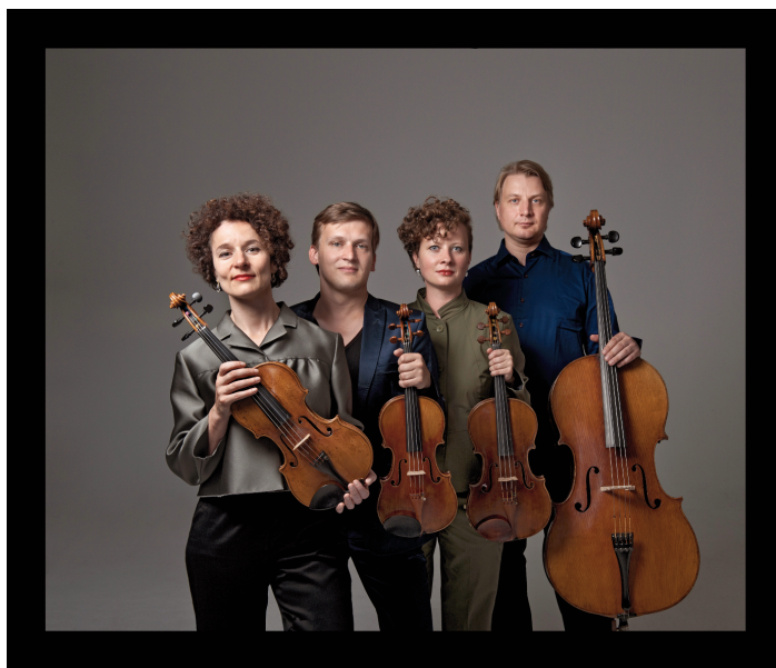
Quatuor Asasello