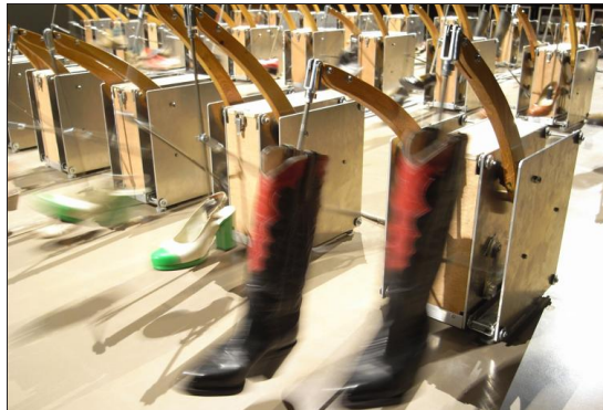
Les Souliers, une installation d'Arno Fabre qui sera présentée au Musée d'Art et d'Histoire de Genève pendant le festival.

En tout cas, Archipel répondra de manière ludique à ces problématiques, comme à son habitude. Faisant feu de tout bois à travers la collaboration avec d'autres arts, comme la danse ou la vidéo. Il y aura par