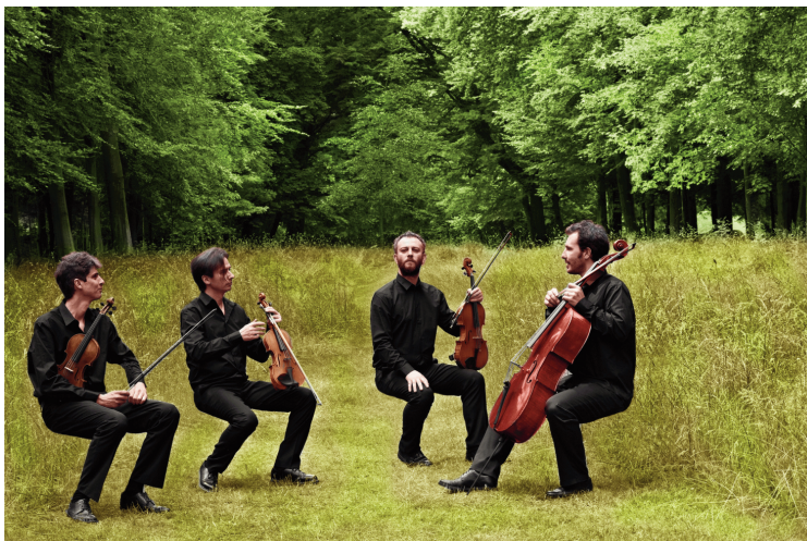
Quatuor Béla.