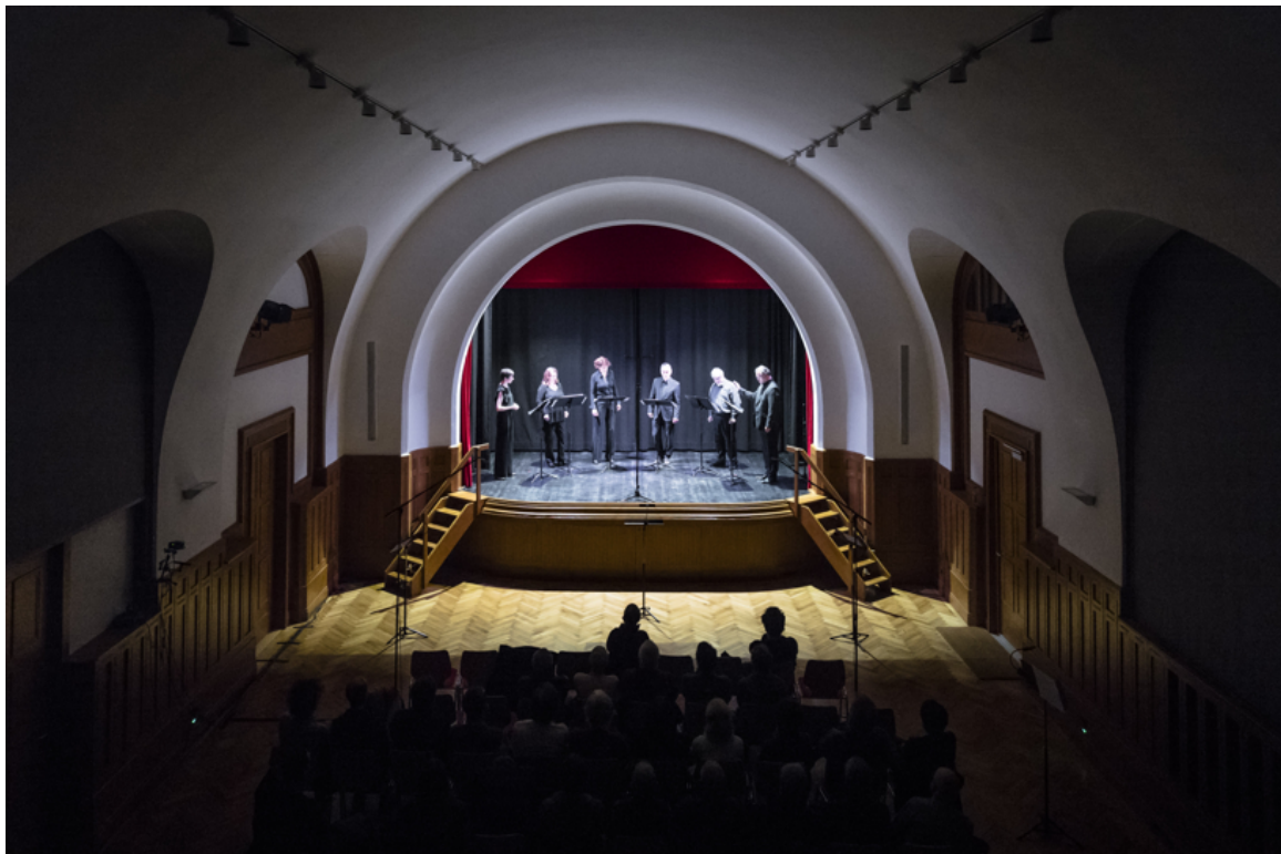
The Neuen Vocalsolisten of Stuttgart at the Festival Archipel 2018 (Salle Trocmé)

The highpoints of the Festival included the concert of the Neue Vocalsolisten of Stuttgart in the Salle Trocmé, which only reopened eighteen months ago. Its excellent acoustics were ideal for the 40-minute-long excerpt from Katharina Rosenberger's vocal performance piece Tempi agitati (2016). Vocal sounds, physical movements, spoken words (Petrarch) and stage performance, all with the rhythmic imprint of Rosenberger's music, together provided an enthralling spatial polyphony in conjunction with musical fragments by the Franco-Flemish Renaissance master Adrian Willaert. It was as if history led straight to the present, which in turn opened up new perspectives on the past.