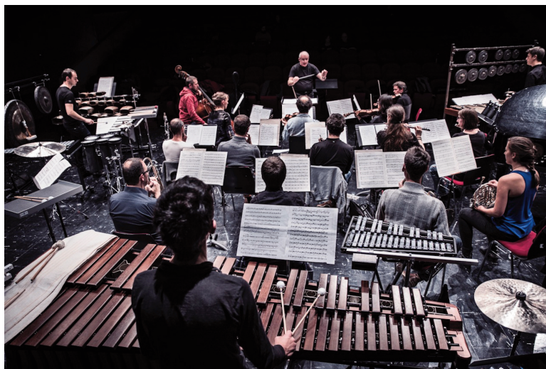
Lemnic Modern Ensemble

Par ailleurs, les élèves de la Confédération des écoles genevoises de musique sont mis à contribution pour une exécution de Tierkreis de Stockhausen à la Fonderie Kugler le mardi 20 mars à 19h. Ce cycle de douze mélodie symbolise les douze signes astrologiques et font intervenir instruments et danseurs.