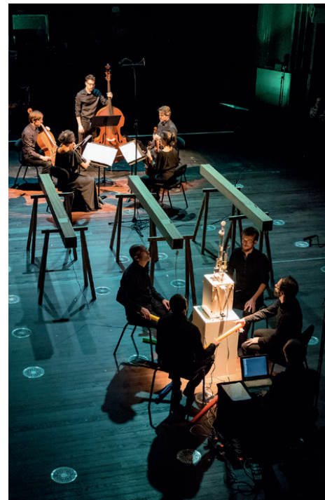
Rites imaginaires : les ensembles NKM et Eklekto dans Hitonokiesari de Masahiro Miwa.